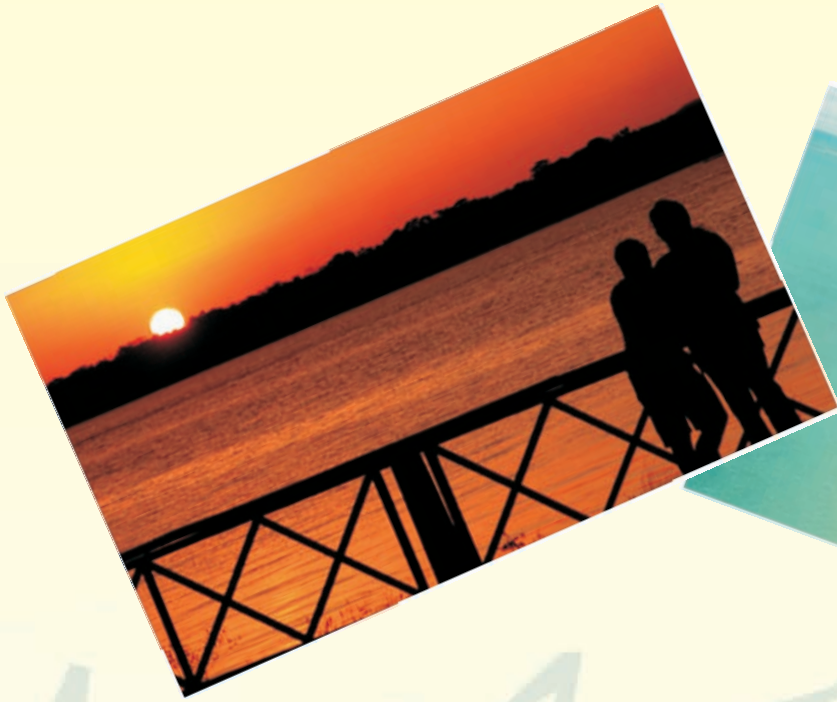
Praia do Jacaré